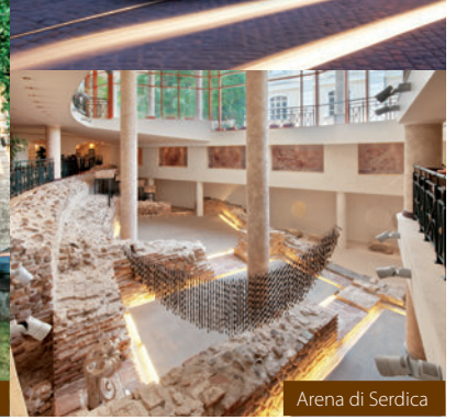
Arena di Serdica